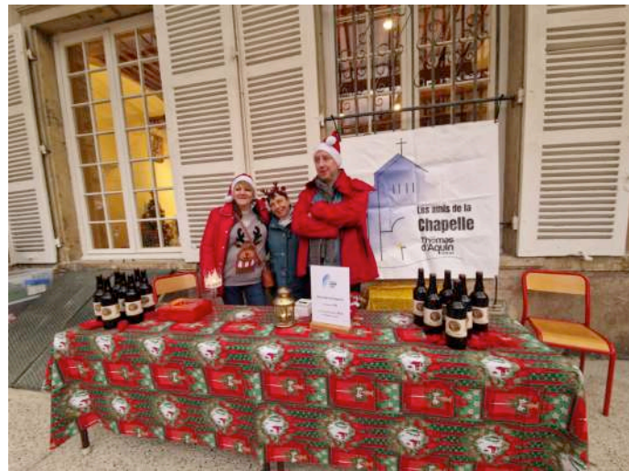
Notre stand avec les bières de la Chapelle

Vernissage de l'exposition de photos de la Chapelle et du site d'Oullins faites par Thibault LAZERT-SAURY, ancien élève et membre du CA, le 21 janvier 2025 : l'exposition a attiré 70 à 80 personnes. L'accompagnement musical par deux violonistes a été apprécié et a créé une chaude ambiance. L'exposition de photos a bien décoré la salle Lacordaire et est restée accessible dans cette salle jusqu'au 21 juin 2025.