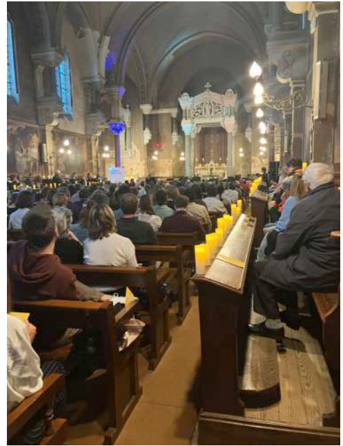
Les deux travées et les bas-côtés de gauche à droite