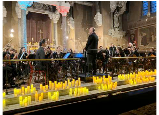
Un moment de grâce dans la Chapelle éclairée à la bougie