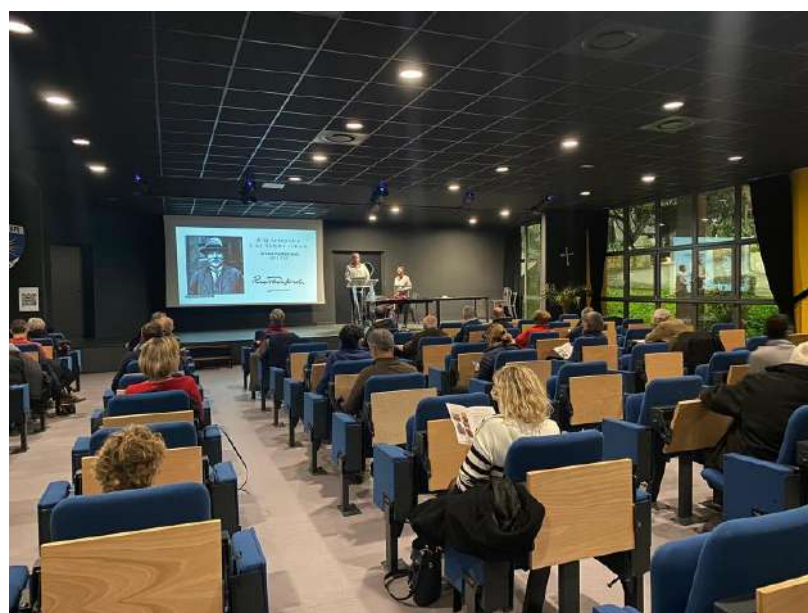
Le public attentif