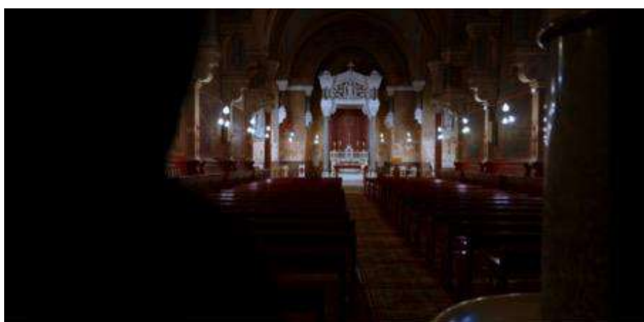
Photogramme du court-métrage « Errance »