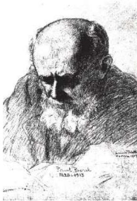
Autoportrait de Paul Borel