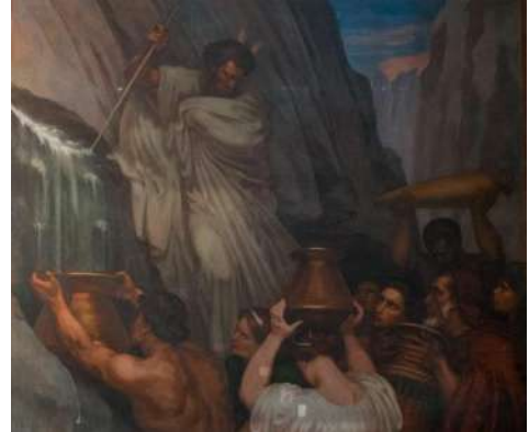
« Moïse faisant jaillir l'eau » de Paul Borel

Paul BOREL (1828-1913) a peint les toiles de la nef de la Chapelle. Dans le côté droit, figurent quatre sujets tirés de l'Évangile des disciples d'Emmaüs et un sujet de l'Ancien Testament : « Moïse faisant sortir l'eau du rocher » (1886). Dans le récit de l'Exode, en pérégrinant à travers le désert du Sinaï, les Hébreux manquèrent d'eau. À nouveau, ils regrettèrent l'Égypte et s'en prirent à Moïse. Celui-ci s'en plaignit à Dieu. Il sortit son prophète d'embarras en lui faisant faire un miracle : « de ton bâton, tu frapperas le rocher, il en jaillira de l'eau, et le peuple aura à boire ». Cette source d'eau vive devint un symbole important pour les chrétiens. Elle représente la grâce de Dieu et Saint Paul compare le Christ au rocher.