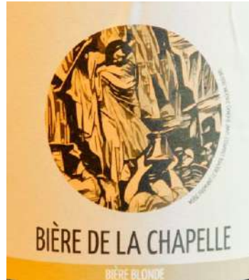
Étiquette créée par Émilande Rollin, d'après Paul Borel