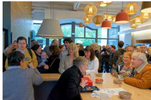
Espace Hannah Arendt