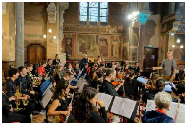
Lyon 3 Orchestra en répétition