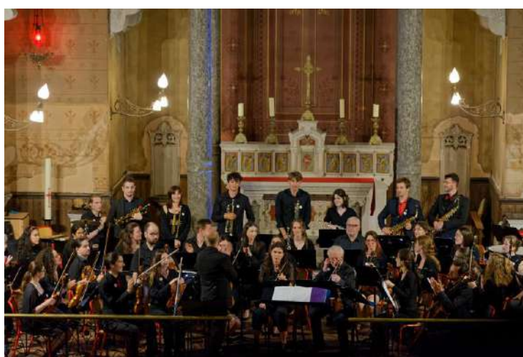
Lyon 3 Orchestra en concert