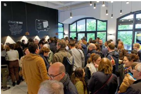
Espace Léonard de Vinci